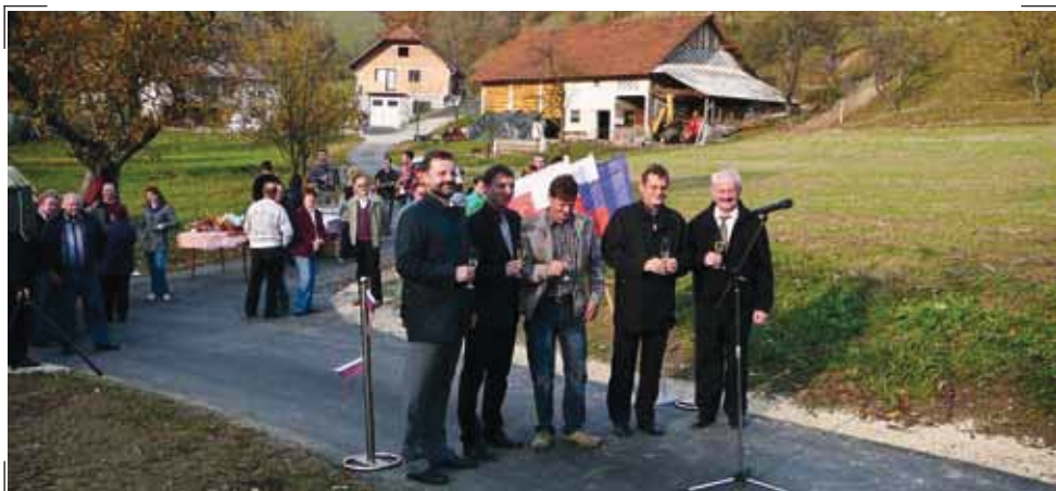
Odprtje ceste Dobje–Straška Gorca

Eden od teh je projekt gradnje večnamenskega objekta na Prevorju. Glede na prvotne načrte se načrtuje manjši objekt, tako da so izpadli stanovanjski del in prostori za potrebe pošte, pridobil pa prostor za parkirišče. Trenutno smo v