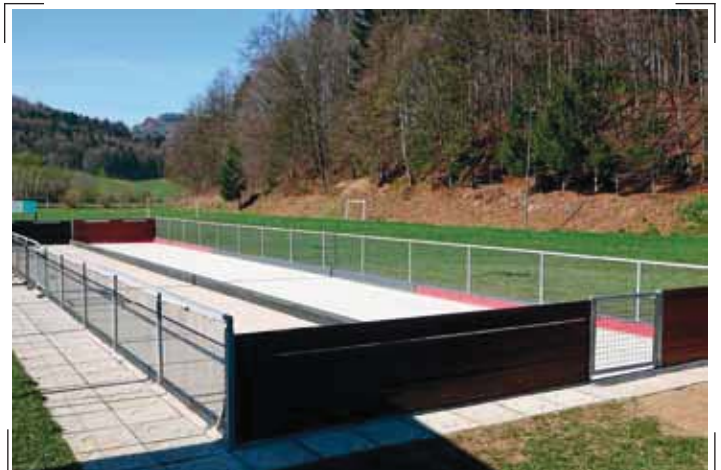
Dograjena je bila še druga steza na balinišču

KS je finančno podprla sanacijo in modernizacijo ceste, parkirišča in dvorišča pri gasilskem domu v Gorici pri Slivnici, ki sta ju izvajala občina in PGD Slivnica pri Celju. Ravno tako je KS finančno podprla dograditev druge steze na balinišču v Gorici pri Slivnici, ki jo je izvajalo Društvo upokojencev Slivnica pri Celju – sekcija balinarjev, ki je v letošnjem letu postala že samostojni klub. Tudi drugim društvom v krajevni skupnosti smo finančno pomagali pri njihovih aktivnostih. Odmevni sta bili prireditvi ob Mar-