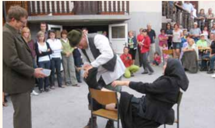
Kulturni program v okviru Guzajevega pohoda