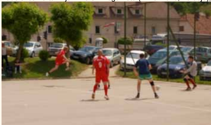
Malonogometna ekipa na Športnih igrah