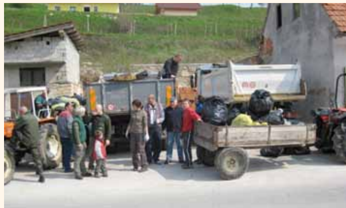
Iz akcije "Očistimo svoj kraj"