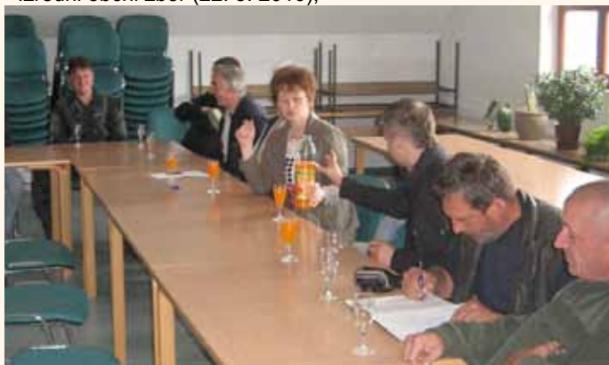
Iz izrednega občnega zbora