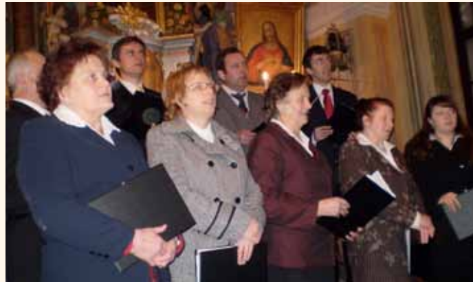
Jubilejni koncert Ljudskih pevcev s Prevorja