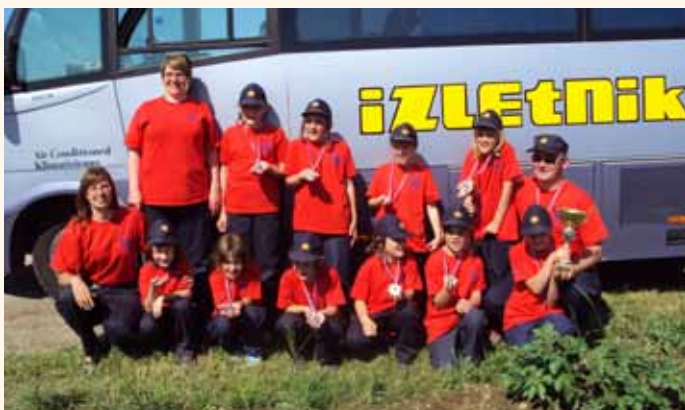
Na državnem tekmovanju so pionirke osvojile 2. mesto