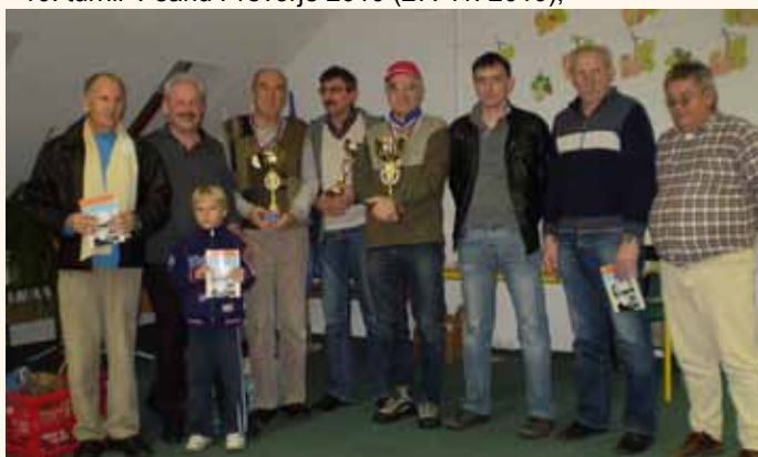
Prejemniki nagrad šahovskega turnirja